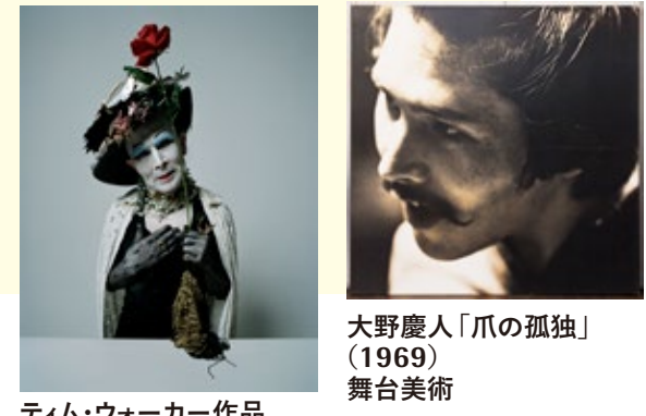
ティム・ウォーカー作品 大野慶人「爪の孤独」(1969) 舞台美術