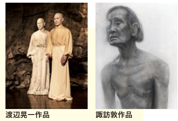
渡辺晃一作品 諏訪敦作品