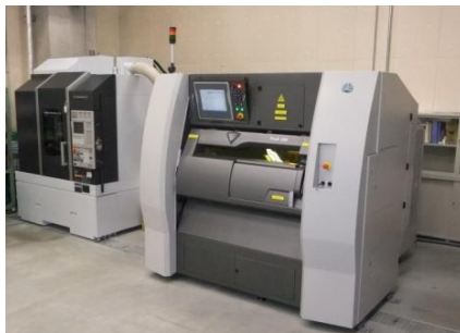
ラボ1（金属粉末積層造形支援）