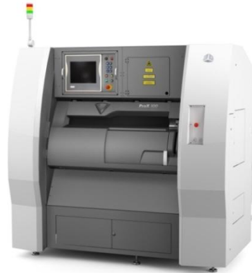
装置外観 © 3D Systems Corporation