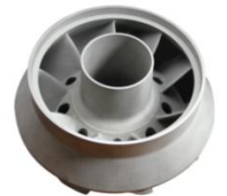
造形品の事例 （エアフォイル）