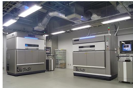
ラボ2（ナイロン粉末積層造形支援）

※AMはAdditive Manufacturingの略で素材を付加する製造方法または加工のことです。