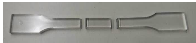
図 3 試験後の様子