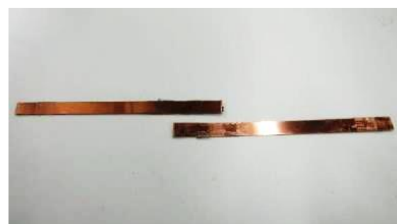
図 3 試験後の様子