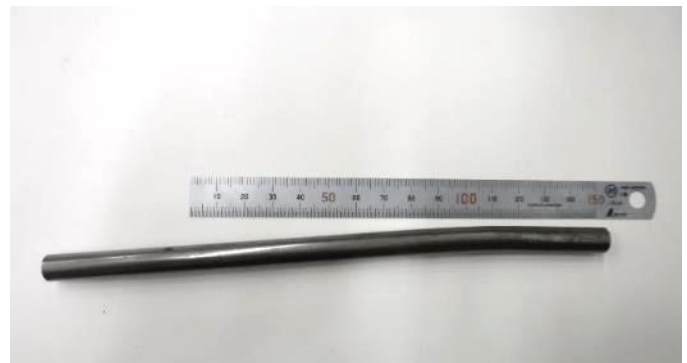
図 3 試験後の様子