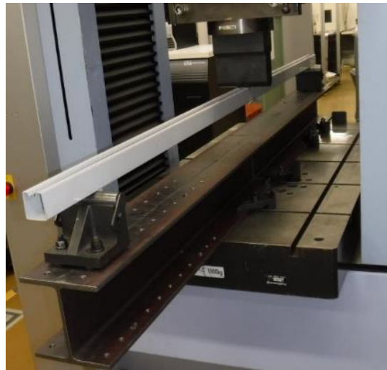
図 1 試験の様子