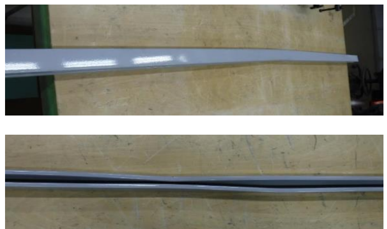
図 3 試験後の様子