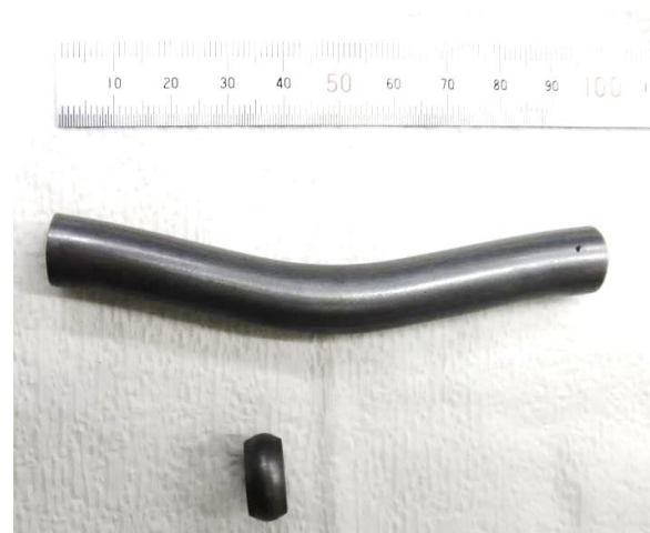
図 3 試験後の様子