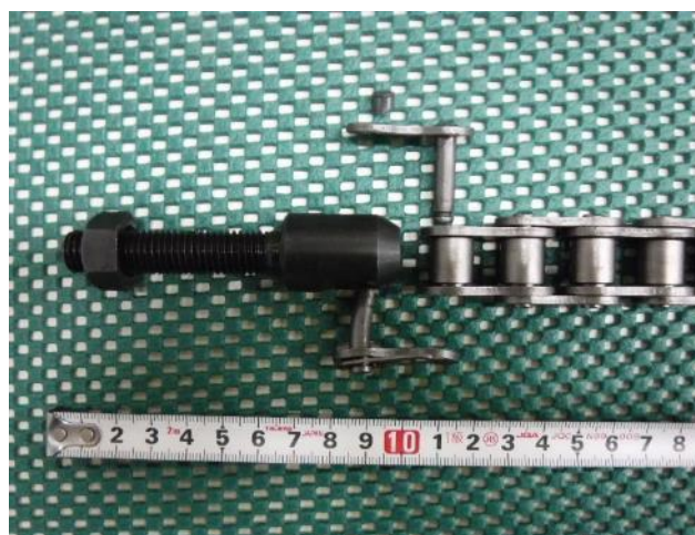
図 3 試験後の様子