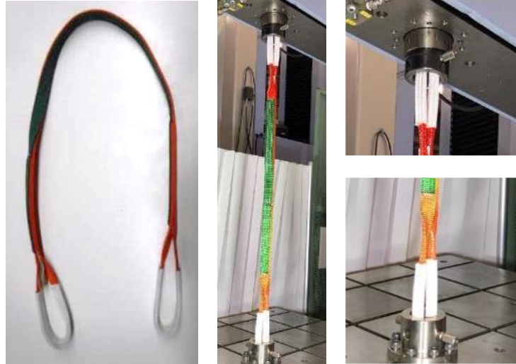
図 1 試験の様子