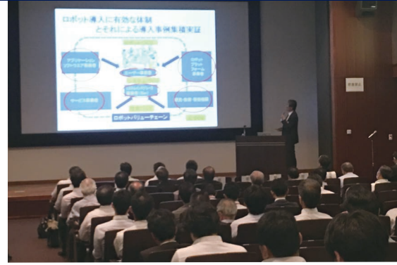
第1回全体会議の様子