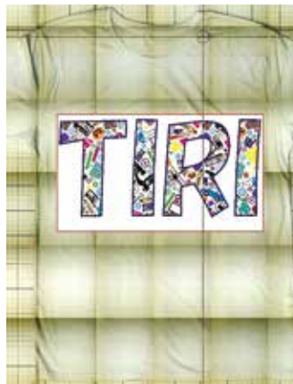
カメラスキャン画像

フラットベッドタイプのため、生地のほかTシャツなど製品形状のものにもプリントすることが可能です。フラットベッド上に製品をセットし、カメラスキャン後にプリント部の位置決めを行うことができるため、プリントミスを少なくすることができます。