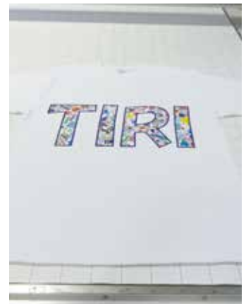
Tシャツへのプリント