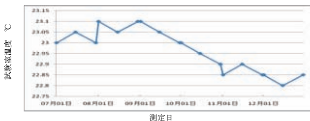
図 2. 温度変化推移