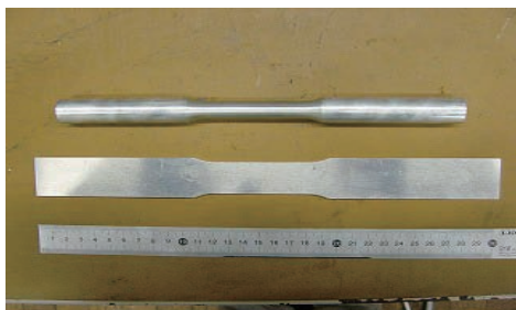
図 1. 評価対象試験片

2.2 試験片 今回の不確かさ要因を調査する試験片は，JIS Z 2201 に規定されている図 1 に示す試験片とした。