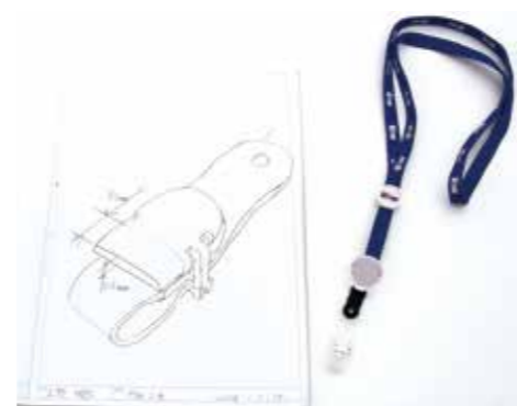
技術相談でお話を伺い、手描きのスケッチでアイデアを具体化

後、「機器利用」で多摩テクノプラザ 電子・機械グループの AM* (3D プリンター) で試作し、形状の確認を行いました。