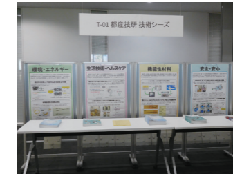
〈都産技研の技術シーズ紹介〉