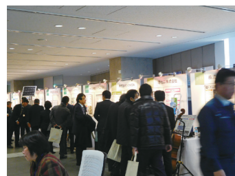
前回の会場の様子

企業の保有技術の優れているところについて、都産技研の客観的な評価データを持って説得力のある PR を後押しすることが、都産技研ならではの「見える化」支援です。