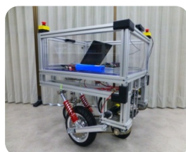
図1. 運搬ロボット1号機