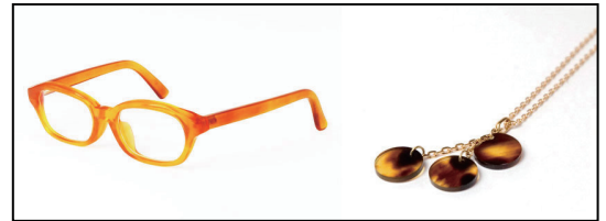
図1. 従来のべっ甲製品

東京都指定伝統工芸の「江戸鼈甲（べっ甲）」を作る東京都鼈甲組合連合（以下、組合）より新たなべっ甲製品の開発依頼があり、都産技研と共同で商品企画開発を行った。従来のべっ甲製品（図1）は眼鏡やアクセサリ関係が中心で、比較的高齢の方がべっ甲製品を利用しているが、より多くの方にべっ甲を知ってもらい、そして新しい販路を開拓するために、今までに無い新しいべっ甲商品を共同で開発することになった。