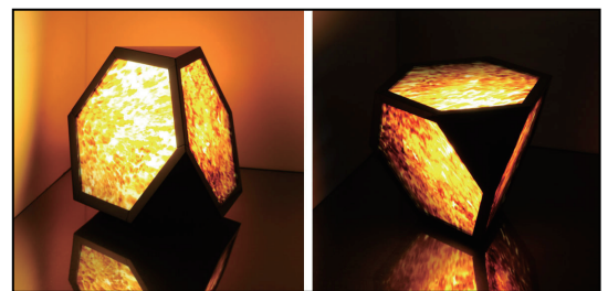
図3. べっ甲ランプシェード

組合が作成した企画書からアイデアスケッチを20点程度作成し、その中からランプシェード、箸、ネームプレート、カチューシャを試作した。開発製品の特徴として、ランプシェードは従来の電球では発熱の問題があり熱に弱いべっ甲では実現できなかったが、低発熱のLEDライトを使用することにより解決した。そして、べっ甲のシンボルマークである六角形をモチーフにして形状をまとめた。べっ甲から通された暖かい光が美しく部屋を灯すことができた（図3）。試作品完成後、東京都伝統工芸品展、雑貨EXPO等の展示会に出展し、多くの反響を得ることができた。また、べっ甲ランプシェードが第7回東京の伝統工芸品チャレンジ大賞にて優秀賞を受賞した。展示会等で得られたさまざまな意見や反響を基に、商品化へとつなげていく予定である（意匠登録 第1433084号、第1439104号、実用新案登録 第3170441号）。