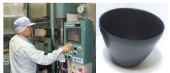
圧縮成形機による製作