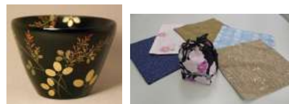
漆塗りおよび加飾