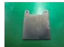
図3 無電解めっき処理