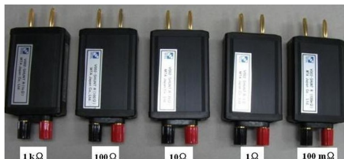
図3 開発したシャント抵抗器