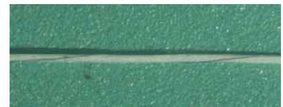
図2 撚糸品 7.5倍拡大 (SUS304 30\mu\text{m} 撚数:300回/m)