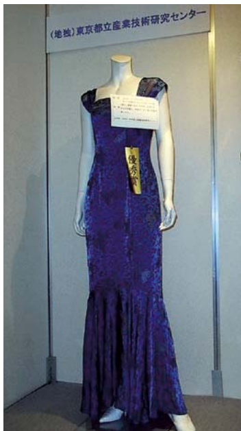
オパール リップル opa+pple ロングドレス

全国繊維交流プラザは全国公設試験研究機関の新技术、新製品開発等の研究成果を発表し、広く中小企業に開発結果を普及することなどを目的とした展示会で、今年度は岐阜県じゅうろくプラザで開催されました。