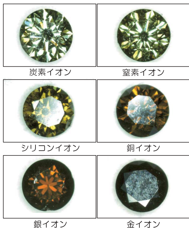
図1 様々なイオンを注入したダイヤモンド

図1にイオン注入によりカラー化したダイヤモンドの写真を一部示します。カラーはイオンの種類により異なり、グリーン、イエローグリーン、ブラウン、ブラックなどのカラー化に成功しました。また、注入量を変えることにより、カラーの濃度を変えることも可能です。