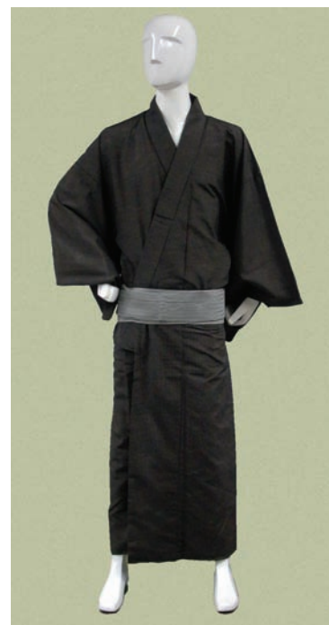
図3 試作した青梅縞の男物きもの