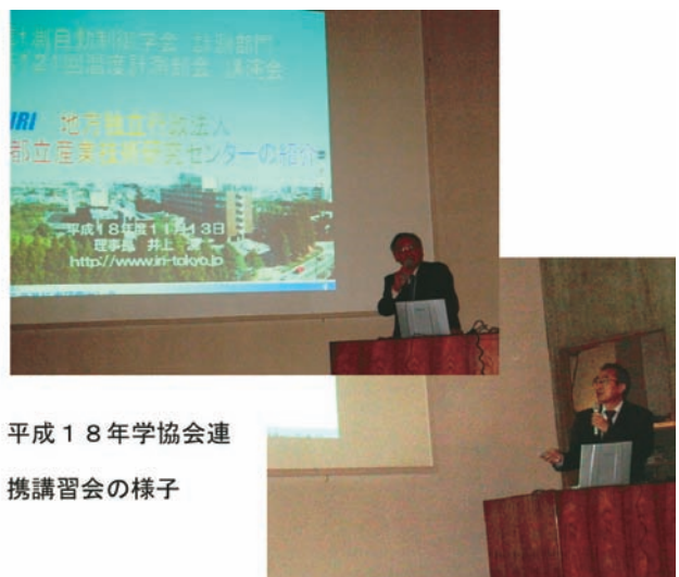
平成18年学協会連携講習会の様子

都内中小企業の方々は無料でご参加していただけます。開催の内容・申し込み方法等は、産技研のホームページ、メールニュースなどのご案内しております。皆様のご参加を心からお待ちしております。