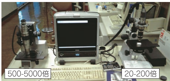
図1 デジタル顕微鏡

(ただし、加工しすぎると元の画像と異なる情報を与えることとなりますので、注意が必要です)