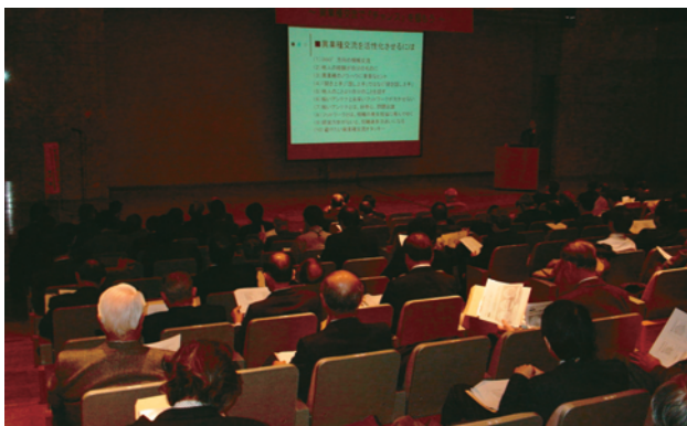
昨年の講演会の様子

1972年(株)日立製作所入社。半導体事業部在職中に国内外の半導体技術開発に関する学術活動と国家プロジェクトメンバー、産官学共同プロセス技術開発推進、半導体生産技術と製造装置の標準化推進に参画。平成10年10月株式会社オムニ研究所設立。プライベートな研修会であるトップ・マネージメント・セミナー(TMS会、通称=吉見会)を主催し、会員数4,800名、参加企業数1,500となり、33年間継続して開催中。