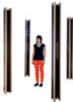
人体3Dデジタイザ 人の全身の形状と表面の質感を同時にデジタルデータ化