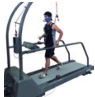
トレッドミル 呼吸代謝装置などと連動して使用し、運動負荷時の人への影響を計測