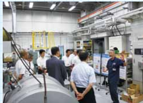
▲講演会後の見学にて