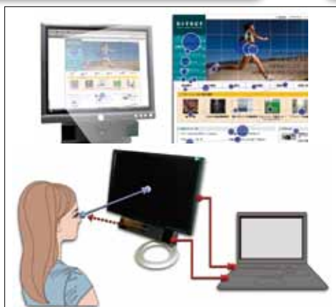
視線追尾システム