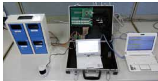
図3 動作デモ時の構成