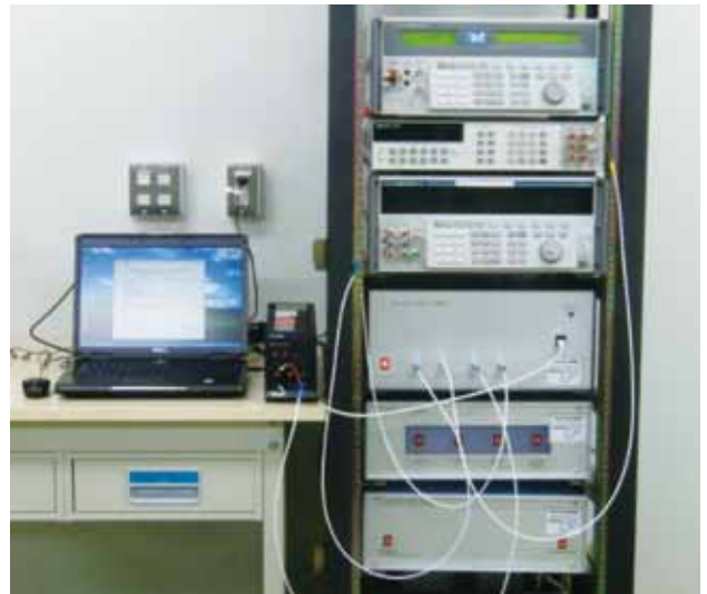
図2 システムの校正装置

圧測定器であるデジタルマルチメータ（DMM）の100mV レンジから100V レンジの自動校正が行えます。直流電圧自動化・不確かさ評価自動化システムの校正装置を図2に示します。