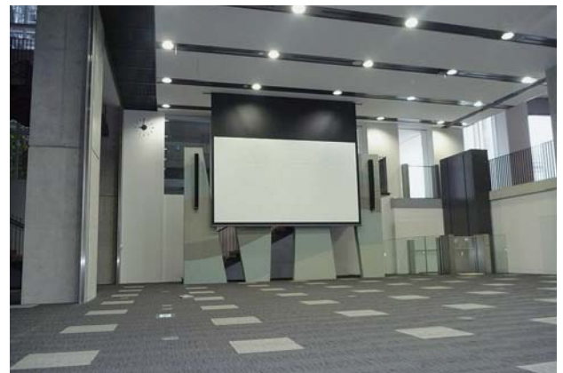
図2 200インチ大型電動スクリーン (H23.5.10撮影)

また、「東京イノベーションハブ」は天井高さを確保するため、中2階に位置しています。そのため、2階からの段差解消機を設置しています。車椅子のお客様も安心してご利用いただけます。