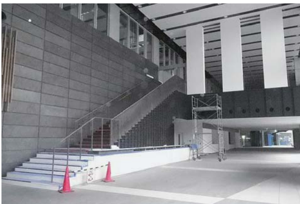
図1 東京イノベーションハブ