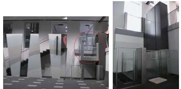
図3 東京イノベーションハブ南側 左図 中2階と2階を結ぶ段差解消機（赤線部分） 右図 段差解消機拡大図（H23.5.11撮影）