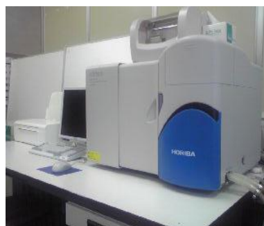
粒度分布測定装置の外観