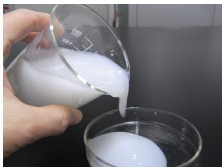
試作したセルロースナノファイバー分散液の外観

機械的解繊法によるセルロースナノファイバー分散液の開発、超微粉碎法による天然アパタイトナノ粒子や難溶性アミノ酸ナノ粒子分散液の開発及び剥離粉碎法による層状化合物（二硫化タングステン固体潤滑剤など）分散液の開発を通じて、高機能塗料、化粧品や潤滑剤など幅広い業界のお客様の課題を解決し、製品化につなげました。