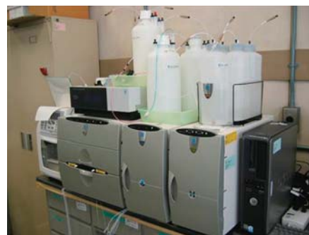
図2 イオンクロマトグラフ

腐食に関連する項目で、イオンクロマトグラフ(図2)を利用して測定します。金属の腐食