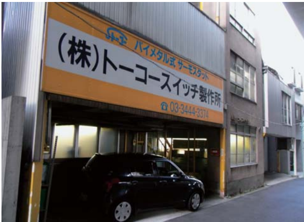
図1 首都高速に面した本社・工場

株式会社トーコースイッチ製作所は1955年（昭和30年）に東京工業所製造部として設立、昭和33年に今のトーコースイッチ製作所と社名を変え、50年以上に渡り品質の良い製品を作り続けてきた会社です。現在ではビルが多く立ち並ぶ恵比寿にありながら、経済成長期には工場地帯であった場所で堅実にものづくりを続けています。