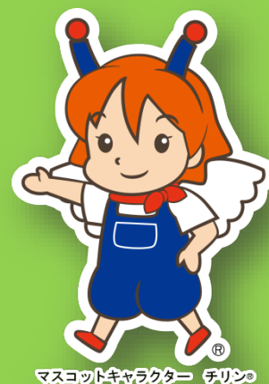
マスコットキャラクター テリン