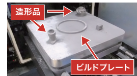
造形終了後の状態