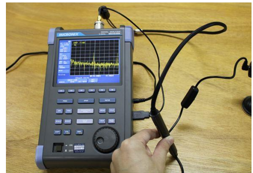
電子機器のEMIノイズ探査