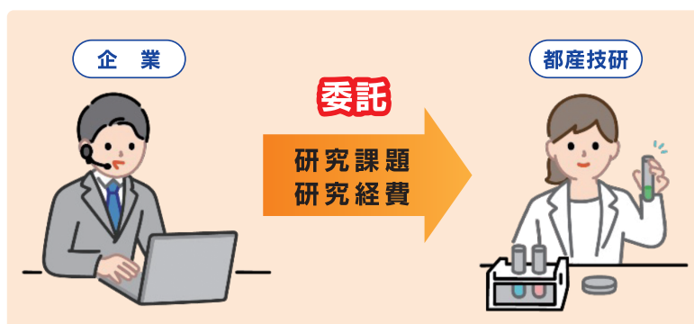
受託研究による製品開発

都内中小企業などからの委託に基づいて、都産技研が短期の研究・調査を行います。随時受付を行っており、企業の研究課題に素早く対応できます。研究費は企業負担となります。