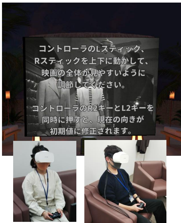
図1 作成したシステム(上)と VR英語シャドーイング中の風景(下)

VR機器を用いて、英語シャドーイング学習を行えるシステムを開発しました。開発したシステムを利用して、アンケート調査を行い、VR英語シャドーイングの普及可能性などを調査しました。