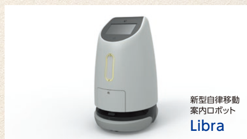
新型自律移動案内ロボット Libra

中小企業と、都産技研が共同開発した、生活や仕事に役立つロボットを展示します。実演・デモにより実際にロボットを体験いただけます。