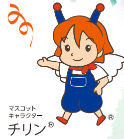
マスコット キャラクター チリン®

1921年(大正10年) 府立東京商工奨励館として設立された都産技研は 2021年に100周年を迎えます。 「変わる産業 変わらない使命」というコンセプトのもと、次の100年へ向け 志を新たに皆さまとともに歩み続ける都産技研を目指します。